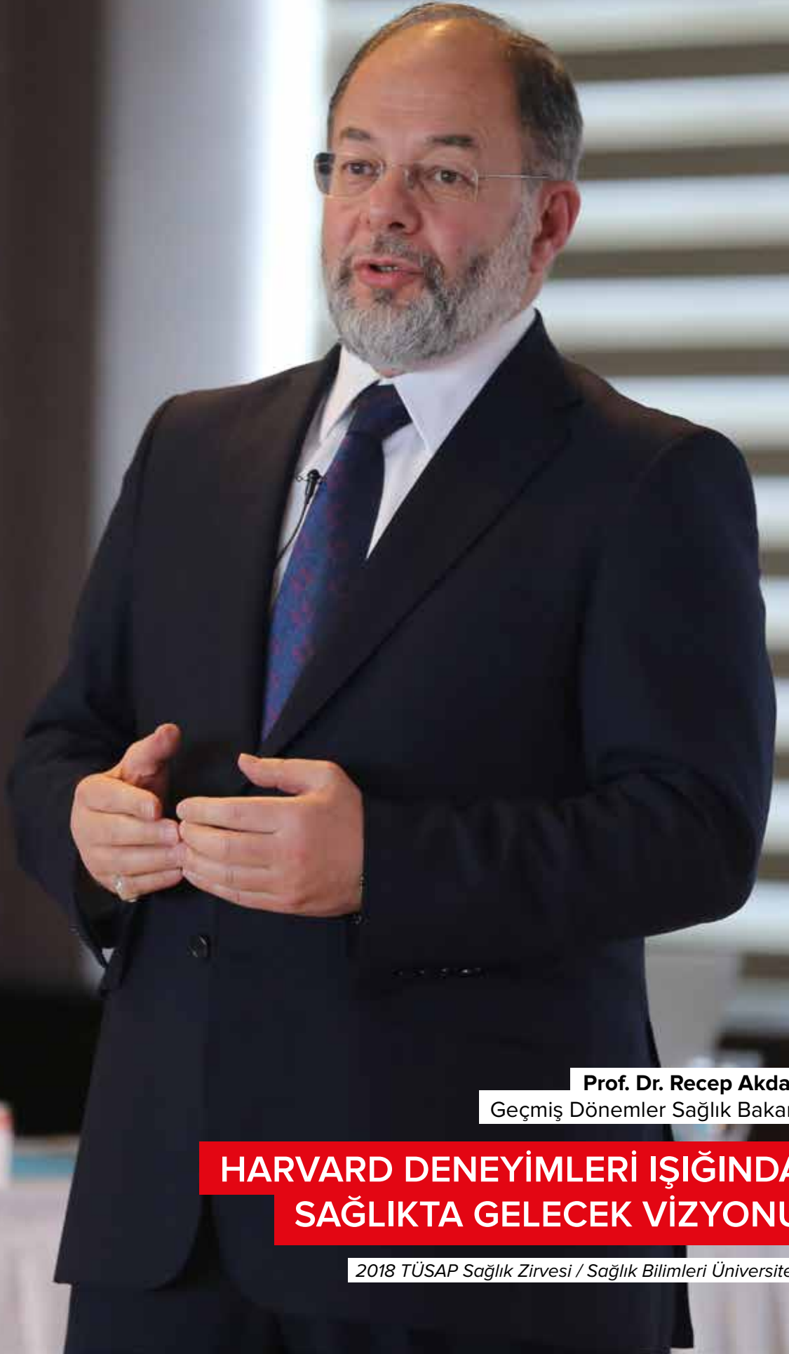
Prof. Dr. Recep Akdağ Geçmiş Dönemler Sağlık Bakanı