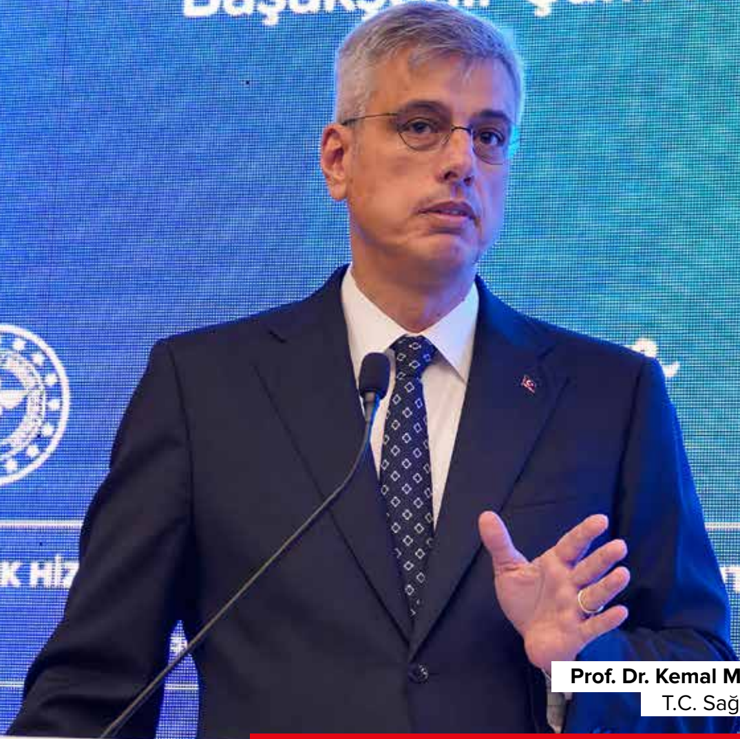
Prof. Dr. Kemal Memişoğlu T.C. Sağlık Bakanı

14 EYLÜL 2024 / Başakşehir Çam ve Sakura