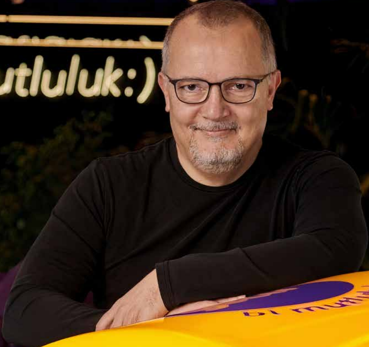
Nazım SALUR Getir Kurucusu